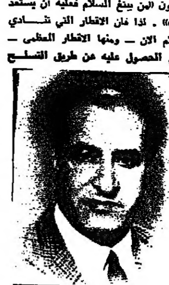
يقلم : نيز شوحيط

اعلان عبقري القديس العشرين البروت اينشتاين عن نظرية النسبية ، قال بعض العلماء بان الانسانية لا تفهم هذه النظرية الا بعد ثمانين عاما . فاذا كان هذا الوعي العبقري في عالم الفيزياء والرياضيات فاننا في عالم التفكير المعنوي نتساءل : ترى كم من السنين والاحساب يجب ان نمر حتى نصل الى الانسانية بروية وعي المثل البسيط الذي امتلته النبي ايشعيا في اصحابه الـ ١٢٠ الف ؟